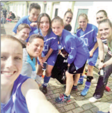
Unsere Frauen-Mannschaft grüßt die ESG 99/06.