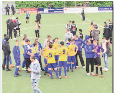
Nach dem Pokalsieg unserer B-Jugend.