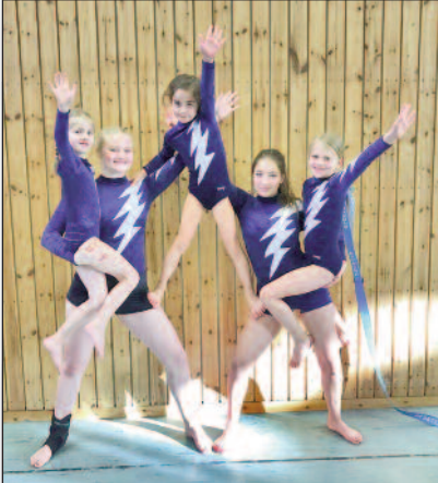
Unsere Turnerinnen bei den diesjährigen Jahrgangsbestenwettkämpfen.