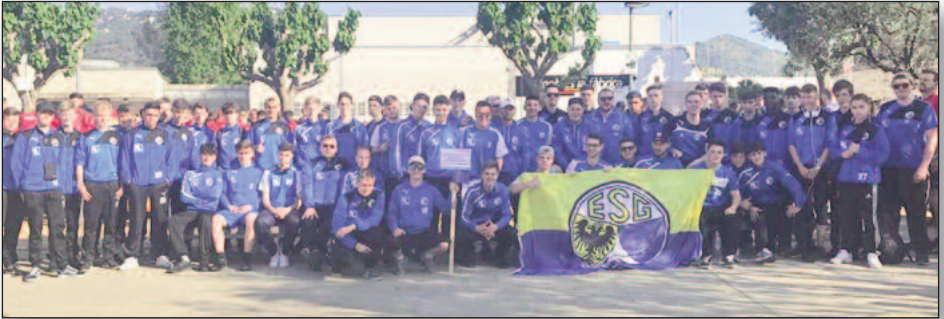
Unsere ESG-Junioren bei ihrer Abschlussfahrt an die Costa de Barcelona.