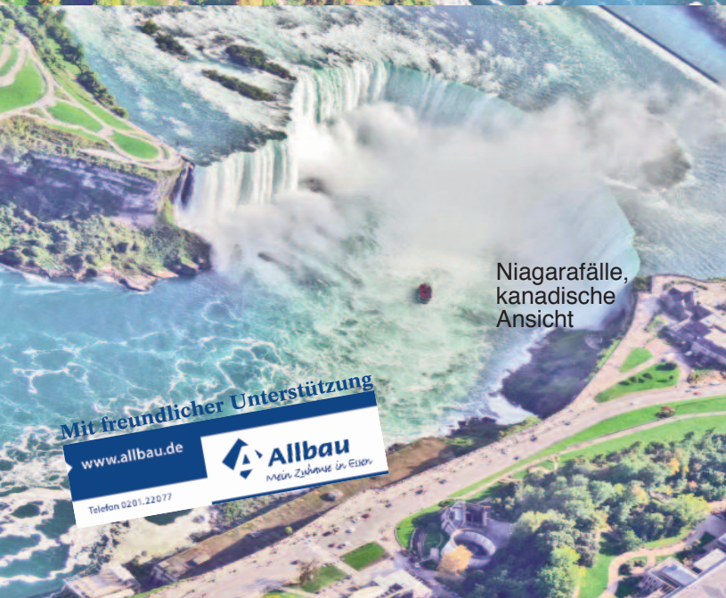
Niagarafälle, kanadische Ansicht