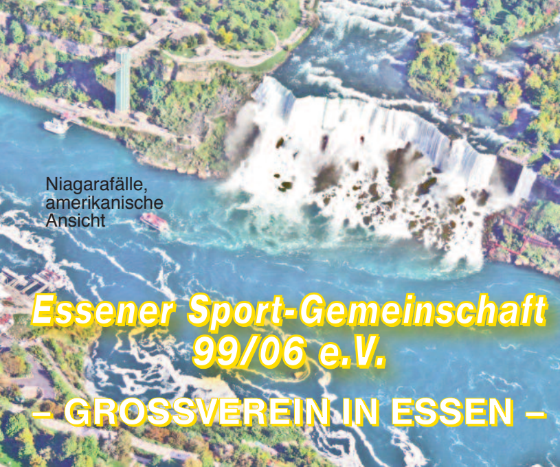
Niagarafälle, amerikanische Ansicht