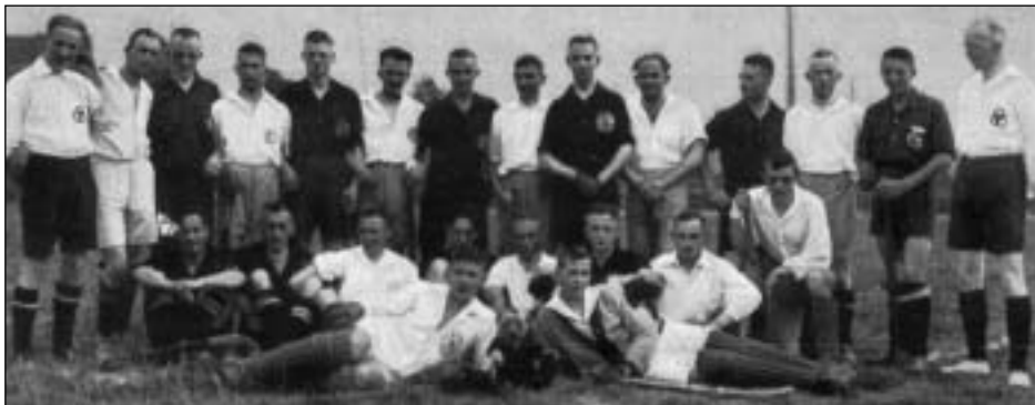
Die in dem Hockey-Turnier siegreiche Mannschaft des ESV.