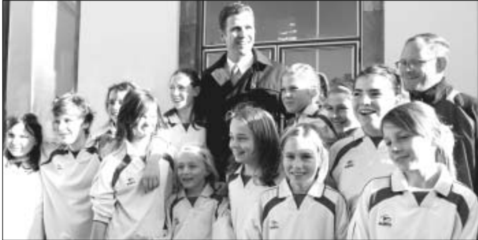
Oliver Bierhoff mit den U13-Juniorinnen der ESG 99/06.

schaften, Trainern und Betreuern eine besinnliche und erholsame Weihnachtszeit, einen guten Rutsch ins neue Jahr 2011 und